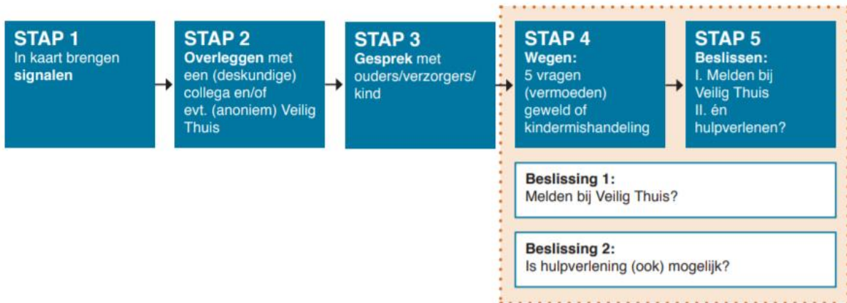
Figuur 1 - beknopte weergave van de meldcode

De meldcode bestaat uit 5 stappen die de leerkracht samen met de aandachtfunctionaris doorloopt.